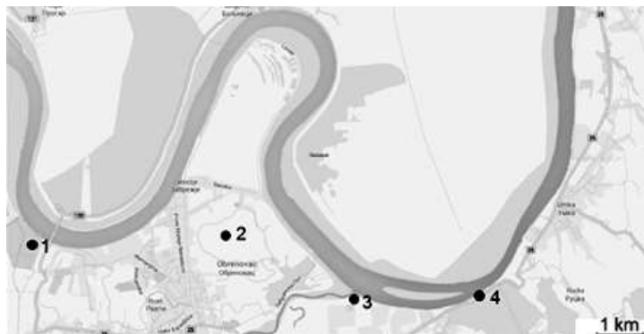
Slika 2. Lokalitet uzorkovanja Duboko. (1) TENT (2) Obrenovac (3) ušće reke Kolubare (4) lokalitet Duboko Figure 2. Sampling site Duboko. (1) TENT (2) Obrenovac (3) confluence of the Kolubara River (4) sampling site

Uzorkovanje vode je vršeno jednom mesečno od januara do decembra 2014. godine na reci Savi, na lokalitetu Duboko, smeštenom nizvodno od grada Obrenovca (Slika 2.).