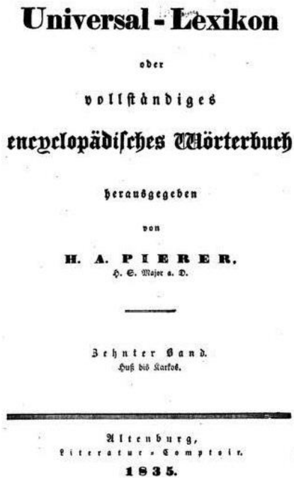
Слика 4: Насловна страна једног тома енциклопедије Universal-Lexikon, oder Vollständiges encyclopädisches Wörterbuch .